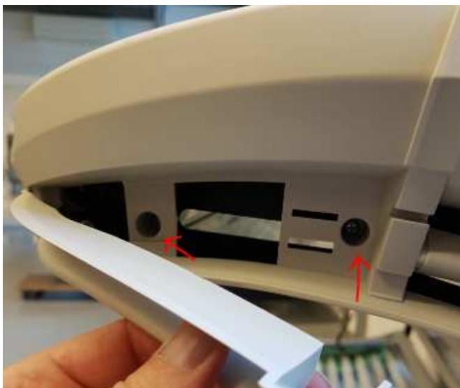
foto onder: Haken losmaken door beide aan weerszijde van het midden gelijktijdig in te drukken